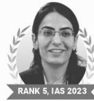
RANK 5, IAS 2023 RUHANI